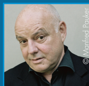
Wolfgang Böck Theaterintendant, Schauspieler