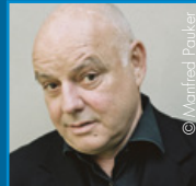
Wolfgang Böck Theaterintendant, Schauspieler