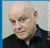
Wolfgang Böck Theaterintendant, Schauspieler